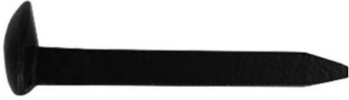
CLAVO DE VÍA de acero