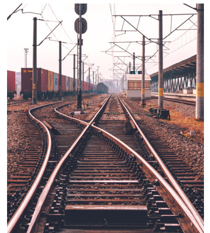
HERRAJES COMPLETOS del #8 y de #10