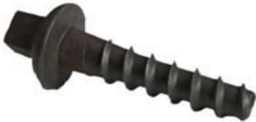
TIRAFONDO DE RIEL de acero