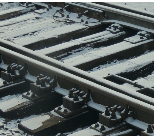
DURMIENTE de acero