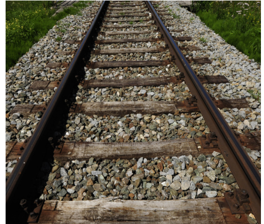
DURMIENTE de madera