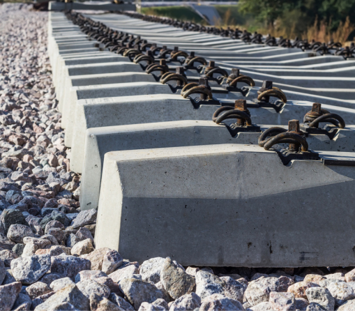
DURMIENTE de concreto